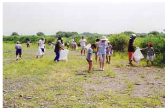
河川愛護活動（鬼怒川クリーン作戦）の参加者