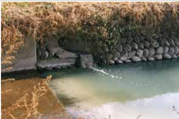
生活排水が流れ込む河川の現状