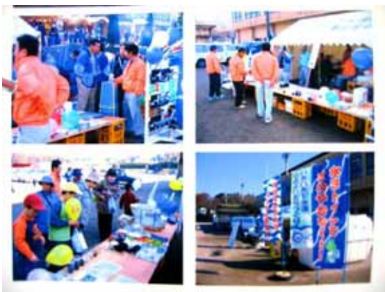
産業祭における普及促進PR