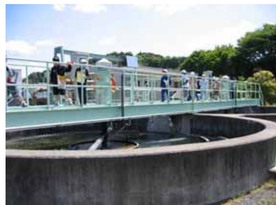
小学生による処理場見学