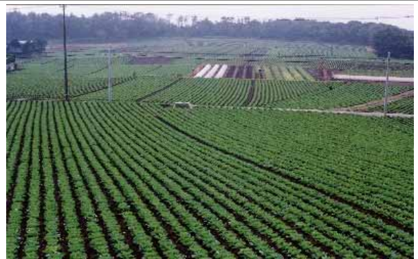
(一面のキャベツ畑)