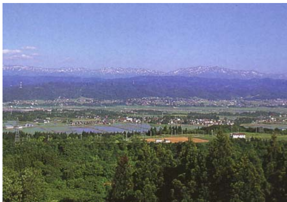
魚沼丘陵より市街地を展望