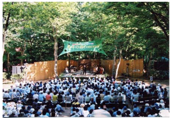
森林浴と音楽を楽しむイベント