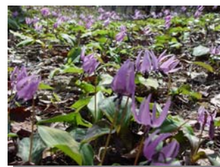
可憐な花を咲かせるカタクリの群生