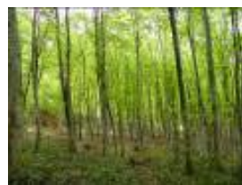
四季の彩りを感じるブナ林