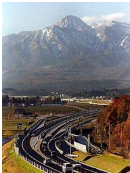
上信越自動車道から望む秀峰妙高山