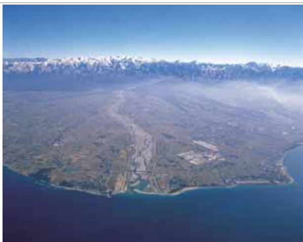
豊富な水資源に恵まれた 黒部川の扇状地に広がる平野と山間部