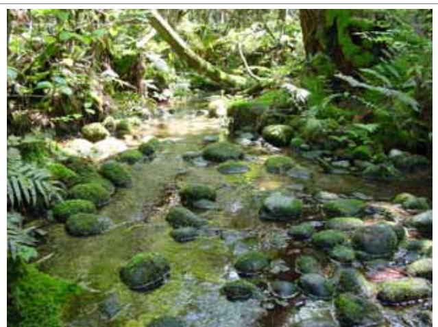
海岸近くに自噴する湧水 (国指定天然記念物杉沢の沢スギ)