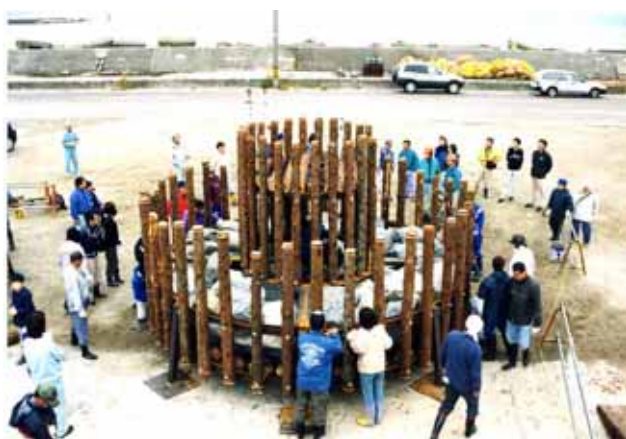
林業関係者と漁業関係者の共同作業によって制作された、間伐材を利用した木製の魚礁 (森とまち、海をつなぐ交流の促進)