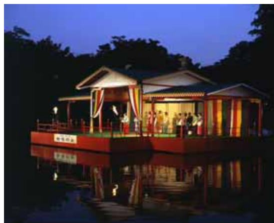
万葉集ゆかりの地として毎年開催される、市民参加のイベント高岡万葉まつり