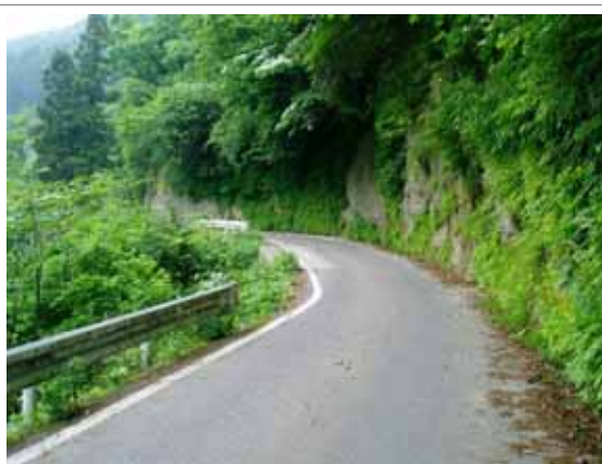
狭隘で急カーブの現況の市道