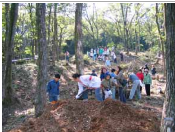
多くの市民が参加した森づくりのイベント