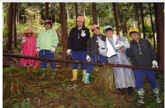
自然と触れ合う機会の提供（森の学習会）