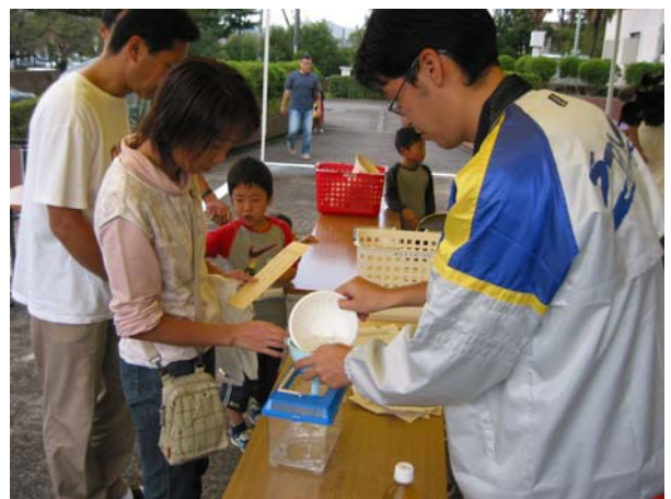
めだかフェスタ（めだか里親募集イベント）