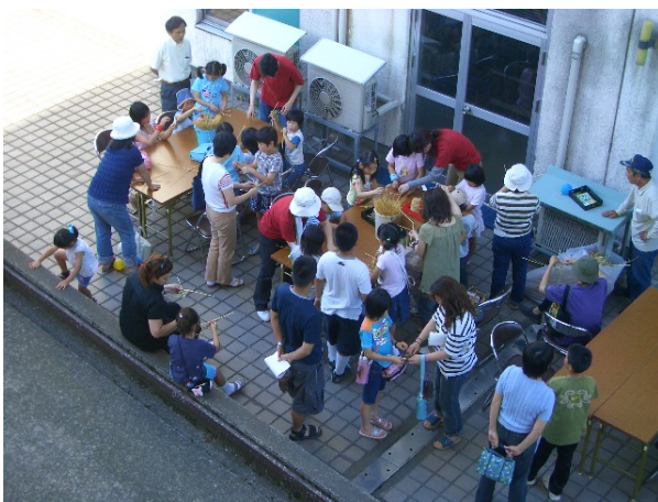
ビオトップフェスタ（ほたるかご作成イベント）