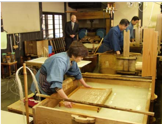
清澄な水で漉かれる越前和紙