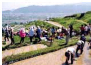
国の名勝指定「姨捨棚田」の田植え