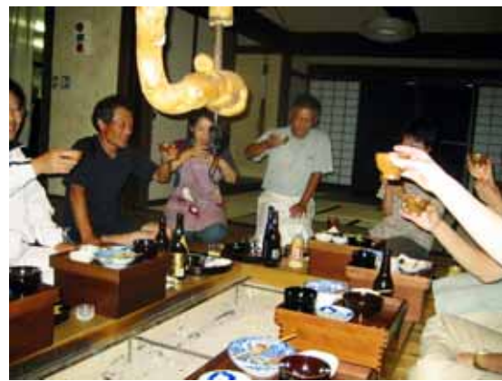
出来上がったドロクで乾杯