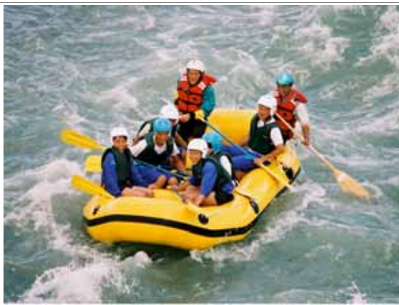
体験教育旅行で天竜川を川下り