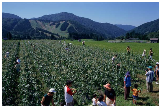
食のふれあい「とうもろこしの収穫祭」