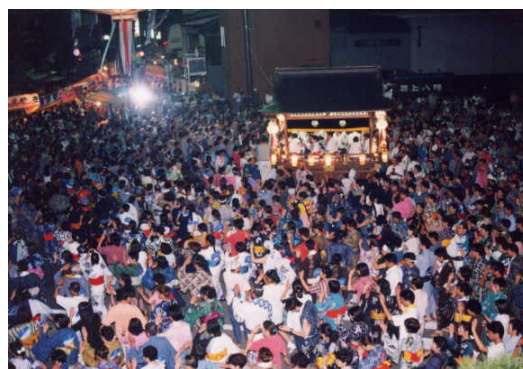
重要無形民俗文化財「郡上おどり」