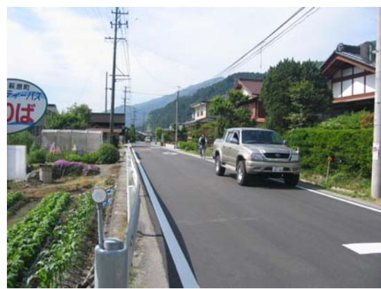
沿道住民の生活道路となる市道