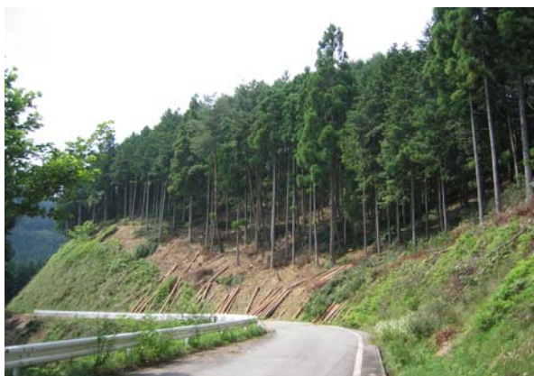
山の手入れが進む林道沿線