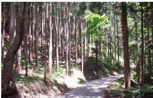
森林整備の推進状況