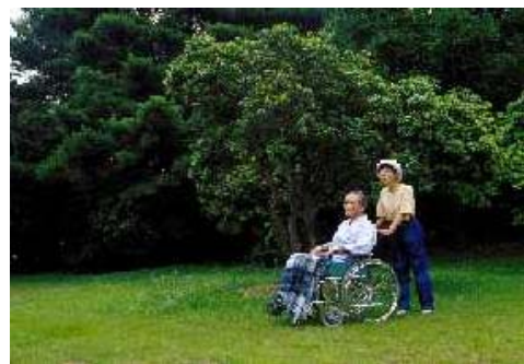
みどりのまちと優しい看護