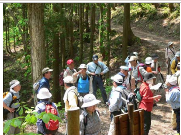
豊かな森林と美しい田園地帯でのトレッキング