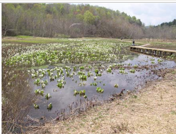
40万株の水芭蕉が咲き誇る池ヶ原湿原