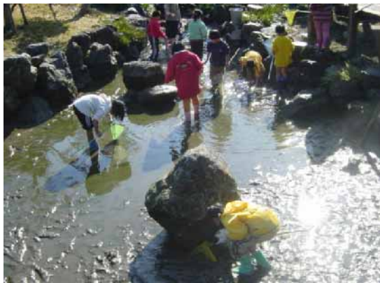
水生生物の棲む池を清掃する小学生