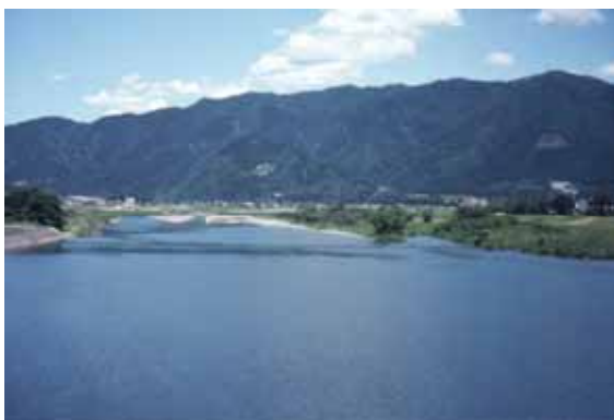
古くから恩恵を受けてきた揖斐川