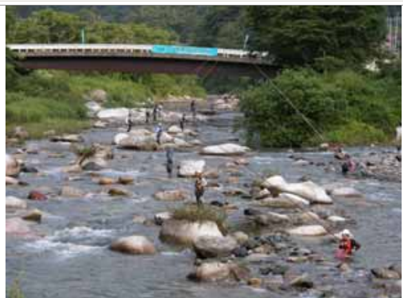
鮎釣りでにぎわう清流