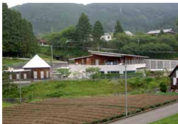
町内の福祉センター（本川根町）