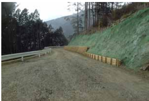
人々の交流が期待される林道整備