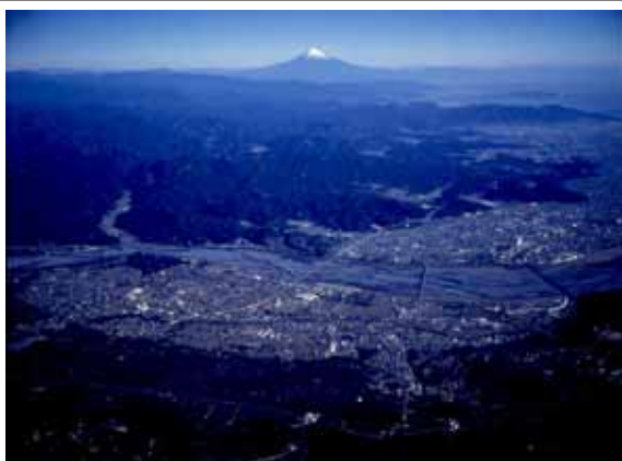
【大井川を縁に結ばれた新生島田市】