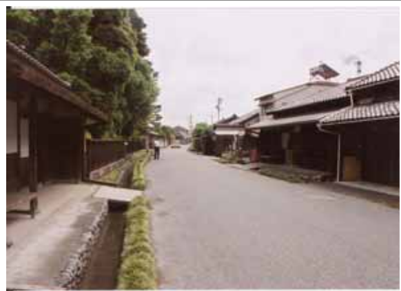
【川越しの宿場町の面影を残す町並み】