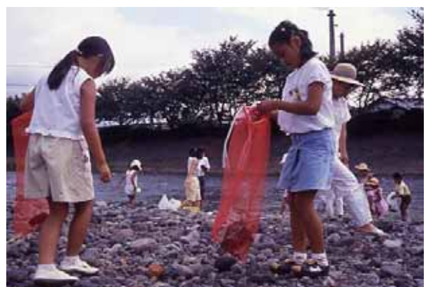
みづか 自ら水からきれいなまちへ