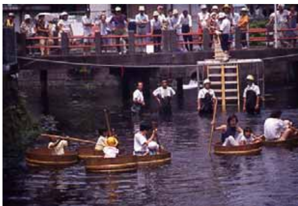
もっともっと清らかな水へ漕ぎ出そう！