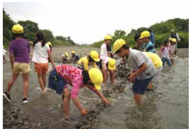
水辺を楽しむ子供達