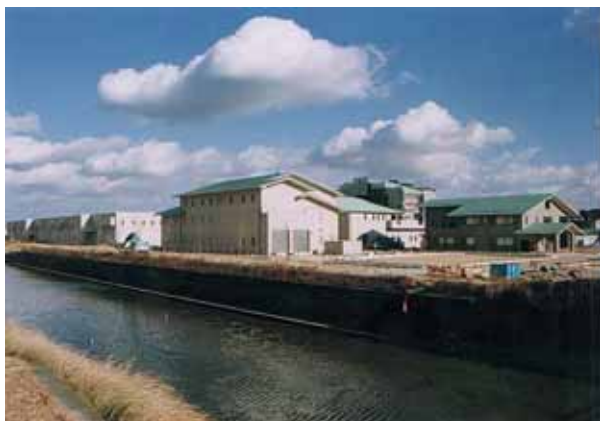
湖西浄化センター