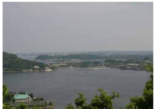
浜名湖と緑豊かなまち