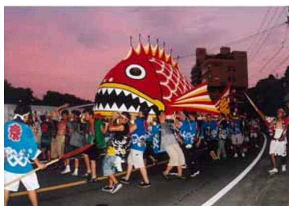
地域の伝統行事「鯛みこし」