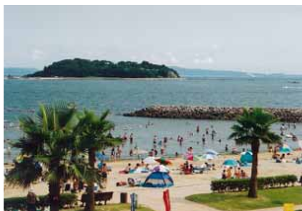
吉良ワイキキビーチ