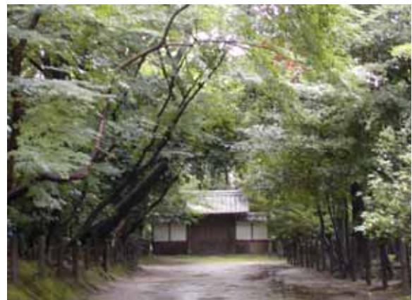
妙興報恩禅寺の緑豊かな森