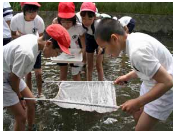
五条川小学校児童による水生生物調査