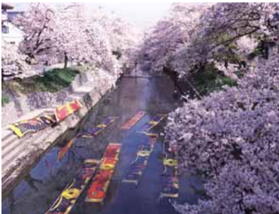
五条川の「のんびり洗い」