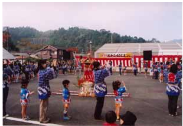
生活創造圏づくり事業