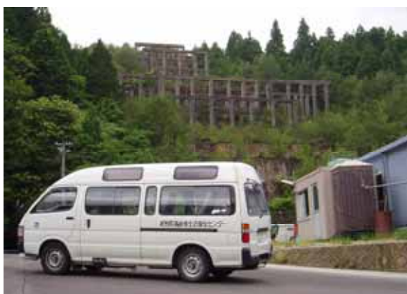
福祉車両と鉦山跡地