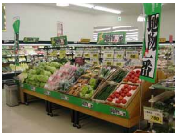
地物一番の日キャンペーン協賛店