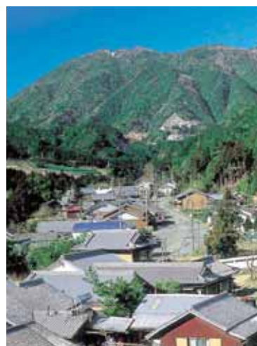
坂 下 宿