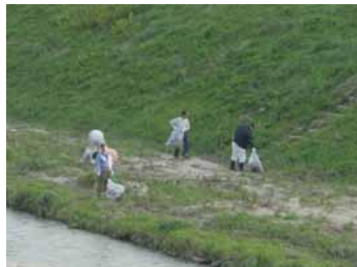
市民参加による美化運動