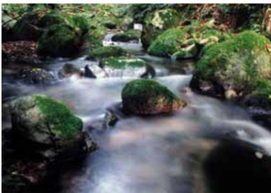
清らかに澄んだ水の創造