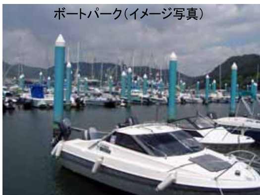
ポートパーク(イメージ写真)