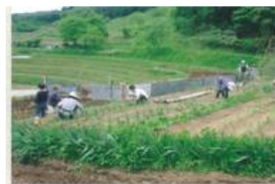
農林業の推進と山村交流