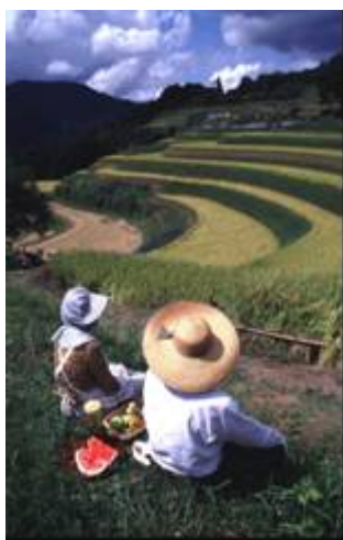
日本の棚田百選（和佐父西ヶ丘地区）