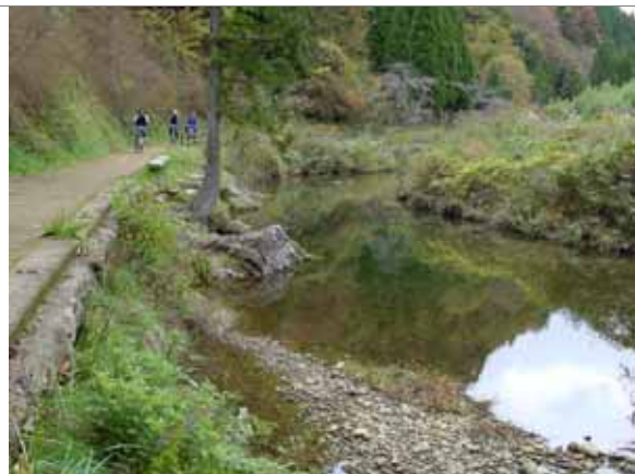
越知川名水街道自転車下り