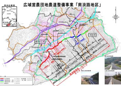
(広域農道・市道の一体的な整備)