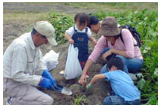
(農村型体験交流施設での産直物販・食の体験教室)