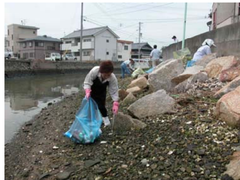
(不法投棄ごみの収集)