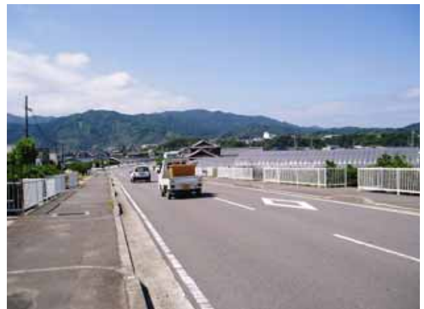
国道 424 号付近の施設（ハウス栽培）