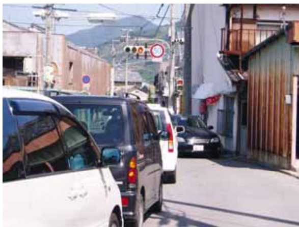
町道中井原本線渋滞状況