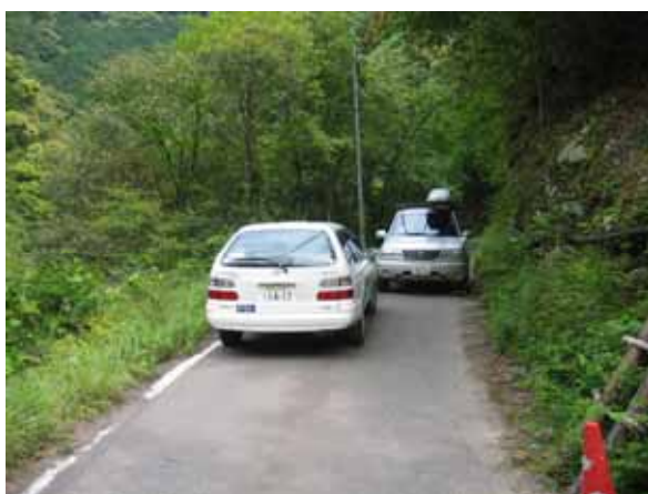
町道西敷屋篠尾線改良計画地