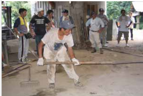
「製炭研修施設」釜だし体験