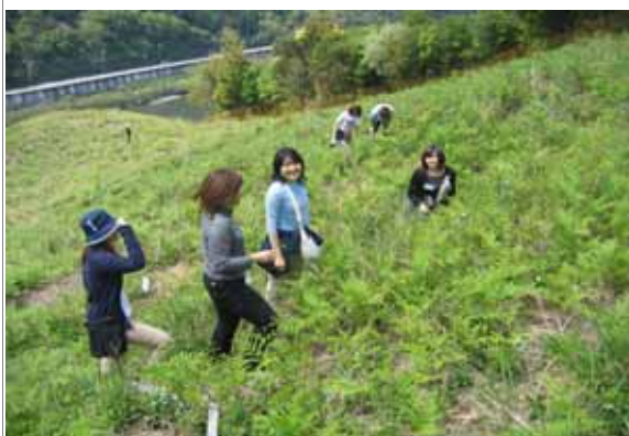
「企業の森」林業体験