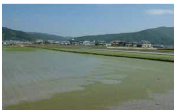
農業集落排水地域