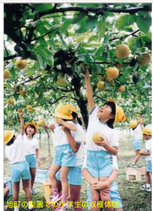
旭町の梨園での小学生の収穫体験