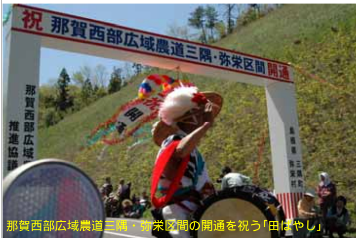
那賀西部広域農道三隅・弥栄区間の開通を祝う「田ばやし」