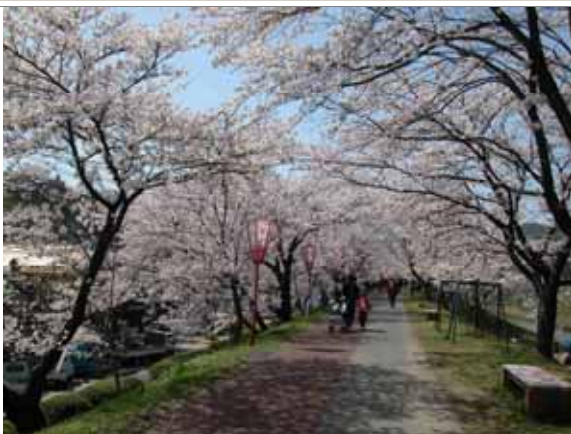
斐伊川堤防桜並木