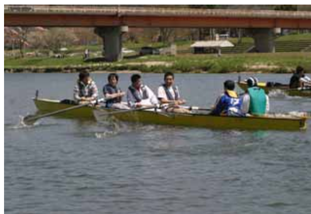
レガッタ大会（斐伊川）