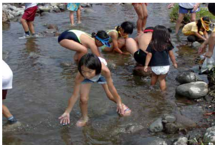
鮎のつかみ取りを楽しむ子供たち