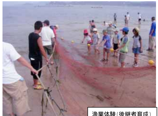
漁業体験(後継者育成)