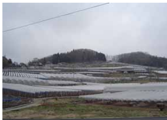
豊永地区のぶどう園地