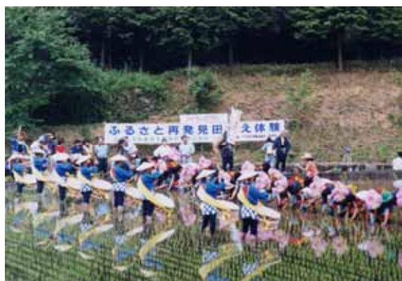
ふるさと再発見田植え体験