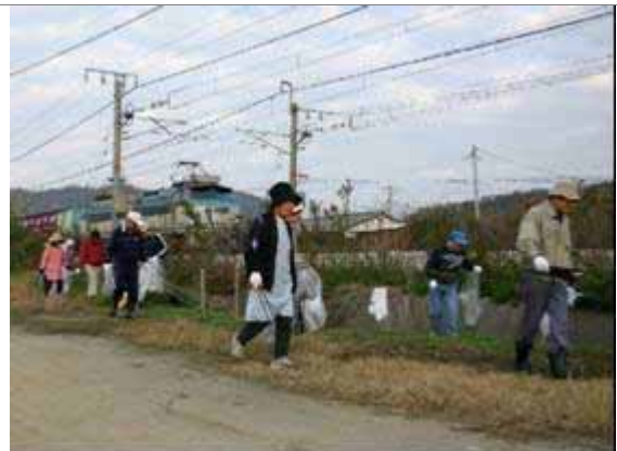
クリーン作戦（町内一斉清掃）