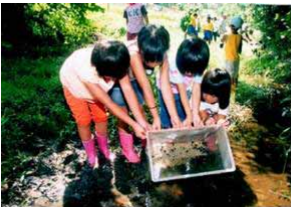
ほたるの幼虫を放流