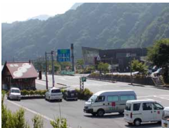
道の駅「来夢とごうち」(安芸太田町)