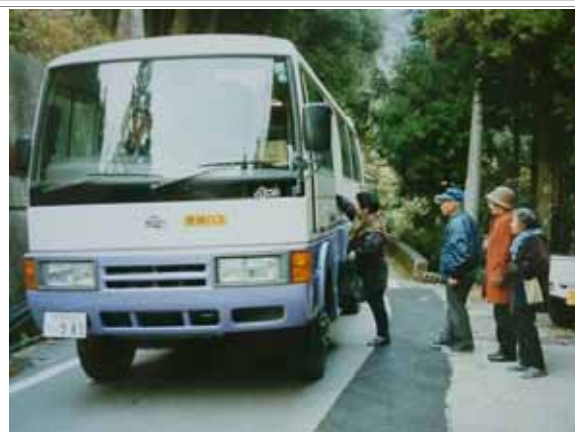
住民の足（路線バス）