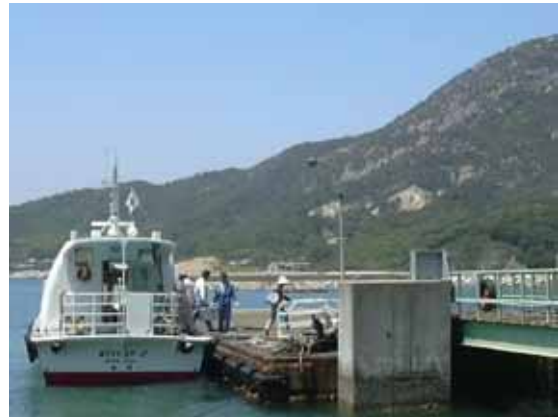
地域住民の足・離島航路