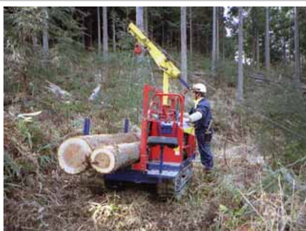
土佐町内での間伐作業