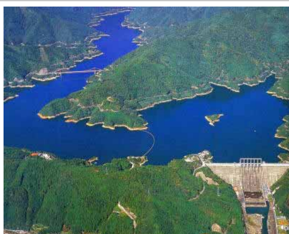
「四国のみずがめ」早明浦ダム